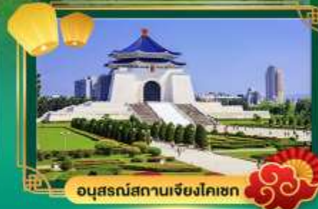
อนุสรณ์สถานเจียงไคเชก