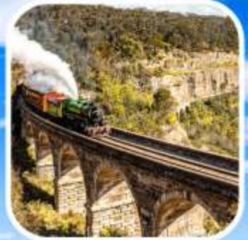
ZIG ZAG RAILWAY

เปิดประสบการณ์ ตามหายักษ์ใหญ่แห่งท้องทะเล ล่องเรือ "CATAMARAN" ชมวาฬ