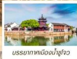
บรรยากาศเมืองน้ำซูโจว