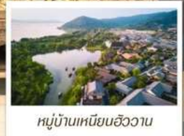
หมู่บ้านเหนียนฮิววาน

🧳 โหลด 23 KG. x1 ทั้งไป - กลับ ✓ พรีเมียมทัวร์ ✓ ไม่เข้าร้านรัฐบาล ✓ ทัวร์กรุ๊ปเล็ก ✓ รวมค่าเข้าชมสถานที่ตามโปรแกรม