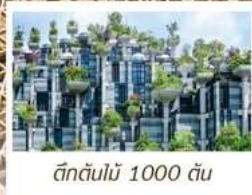
ตึกต้นไม้ 1000 ต้น