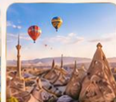
CAPPADOCIA คัปปาโดเกีย