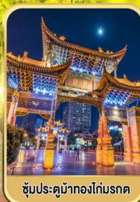
ซุ้มประตูม้าทองไถ่มรดก