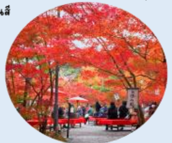
ที่ให้ภาพบรรยากาศท้องถื่นของลานหนึ่งสีแดง ที่ปกคลุมไปด้วยใบไม้เปลี่ยนสี