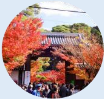
จุดประตูไซมง เป็นประตูทางเข้าหลักของวัดเอคันโด

นำท่านเดินทางสู่ เกียวโต เป็นเมืองที่ได้ชื่อว่าเมืองแห่งศิลปะและวัฒนธรรมของญี่ปุ่นอย่างแท้จริง จากนั้นนำท่านเยี่ยมชม วัดเอคันโด (Eikan-do) วัดสวยที่มีชื่อเรียกขานถึง 3 ชื่อ ไม่ว่าจะเป็น เซนรินจิ, โซจูโรงะซัง หรือ มูเรียวจูอิน วัดนี้ตั้งอยู่บริเวณปลายสุดทางทิศใต้ของ "ทางเดินนักปราชญ์" ในย่านฮิงาชิยามะ โดดเด่นด้วยอาคารไม้โบราณที่เชื่อมถึงกันด้วยทางเดินมีหลังคาคลุมลัดเลาะไปตามสวน วัดเอคันโด มีประวัติศาสตร์ยาวนานตั้งแต่สมัยเฮอัน โดยเริ่มจากขุนนางระดับสูงได้มอบพื้นที่แห่งนี้ให้เป็นที่พำนักของพระสงฆ์ ภายในวัดเต็มไปด้วยงานศิลปะที่ทรงคุณค่า โดยเฉพาะ รูปปั้นพระอมิตาพุทธ ที่มีเอกลักษณ์ไม่เหมือนใคร เพราะพระเศียรจะหันไปทางด้านข้าง ซึ่งมีตำนานเล่าว่า พระองค์เคยหันมาพูดคุยกับเจ้าอาวาสนั่นเอง นอกจากนี้ ที่นี่ยังเป็น "แลนด์มาร์ค" อันดับหนึ่งสำหรับการชมใบไม้เปลี่ยนสีในช่วงปลายเดือน พฤศจิกายน ซึ่งจะสวยงามเป็นพิเศษทำให้บรรยากาศดูราวกับอยู่ในเทพนิยาย ภายในวัดมีมุมถ่ายรูปเก๋ๆ กับใบไม้แดงเพียบ