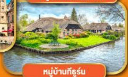
หมู่บ้านก็ธูร์น