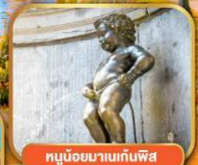
ทูน้อยมาบนแท่นพิส