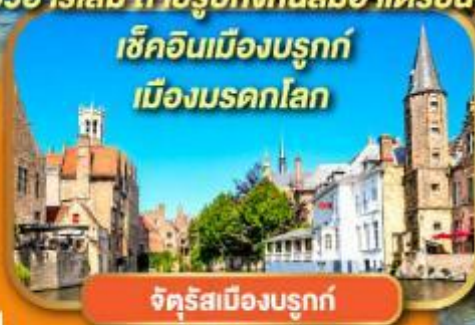
จัตุรัสเมืองบรูค