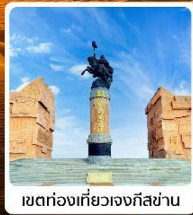
เขตท่องเที่ยวเจงกีสข่าน