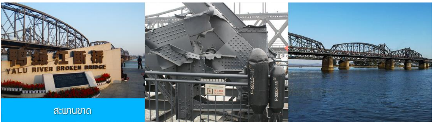
สะพานขาด