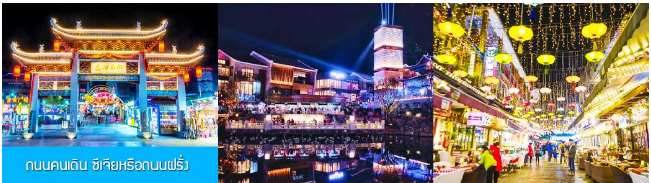
ถนนคนเดิน ซิเจียหรือถนนฝรั่ง