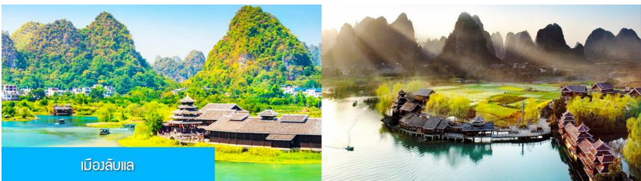
เมืองลับแล

พักที่ YANGSHUO ELITE GARDEN HOTEL ระดับ 4 ดาวท้องถิ่นหรือเทียบเท่าใน เมืองหยางชว่