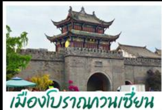
เมืองโบราณทวนเซี่ยน

ภูเขาสิ่วรุณี - อุทยานป่ฝิงโกว - สะพานหนานเฉียว - ร้านหนังสือจงซูเก๋ - เมืองโบราณกวนเสียน จตุรัสหยางเทียนหวู่ - หมู่เพนต้าซลฟี - ถนนโบราณชอยกว้างชอยแคบ - ถนนคนเดินไท่กูหลี่ ถนนคนเดินซุนซี - ถนนโบราณจินหลี่ - เพนต้าฮักซิงตึก - บ้านฟูไมไฟติกSKP - วัดต้าฉือ