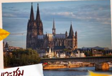
แควซ่ม มเซาเวินโคโลญ