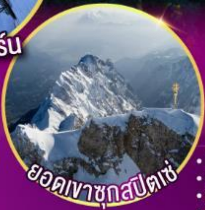
ยอดเขาซุกสปีตเซ