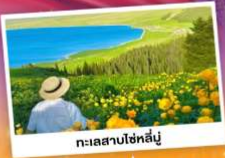
ทะเลสาบไซหลู่