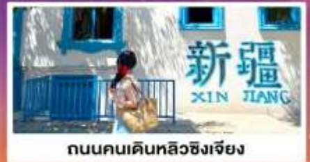
ถนนคนเดินหลิวซิงเจียง