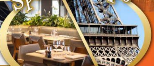
รับประทานอาหารกลางวันบนหอคอยเฟา

ไฮไลท์ในโปรแกรม • สะพานไมชาเปเล ลูเซิร์น