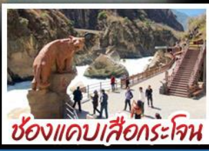
ช่องแคบเสือกะโจน