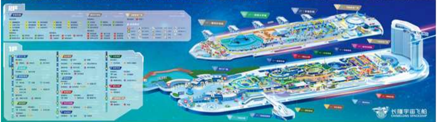
คำ | บริการอาหารทำนด้วยบุฟเฟ่ต์ของโรงแรม อิสระตามอัธยาศัย พักในสวนสนุก 📍 โรงแรม ZHUHAI SPACESHIP HOTEL (1)