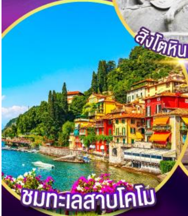
ชมทะเลสาบโคโม