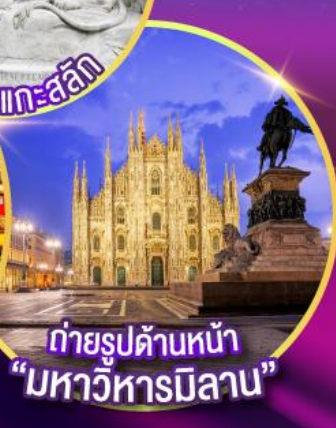
ถ่ายรูปด้านหน้า "มหาวิหารมิลาน"