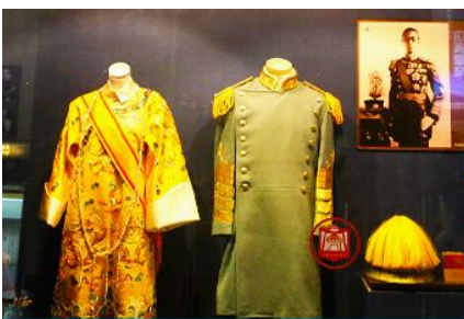
พระราชวังปู้ยี้

เช้า รับประทานอาหารเช้า ณ ห้องอาหารของโรงแรม (7)