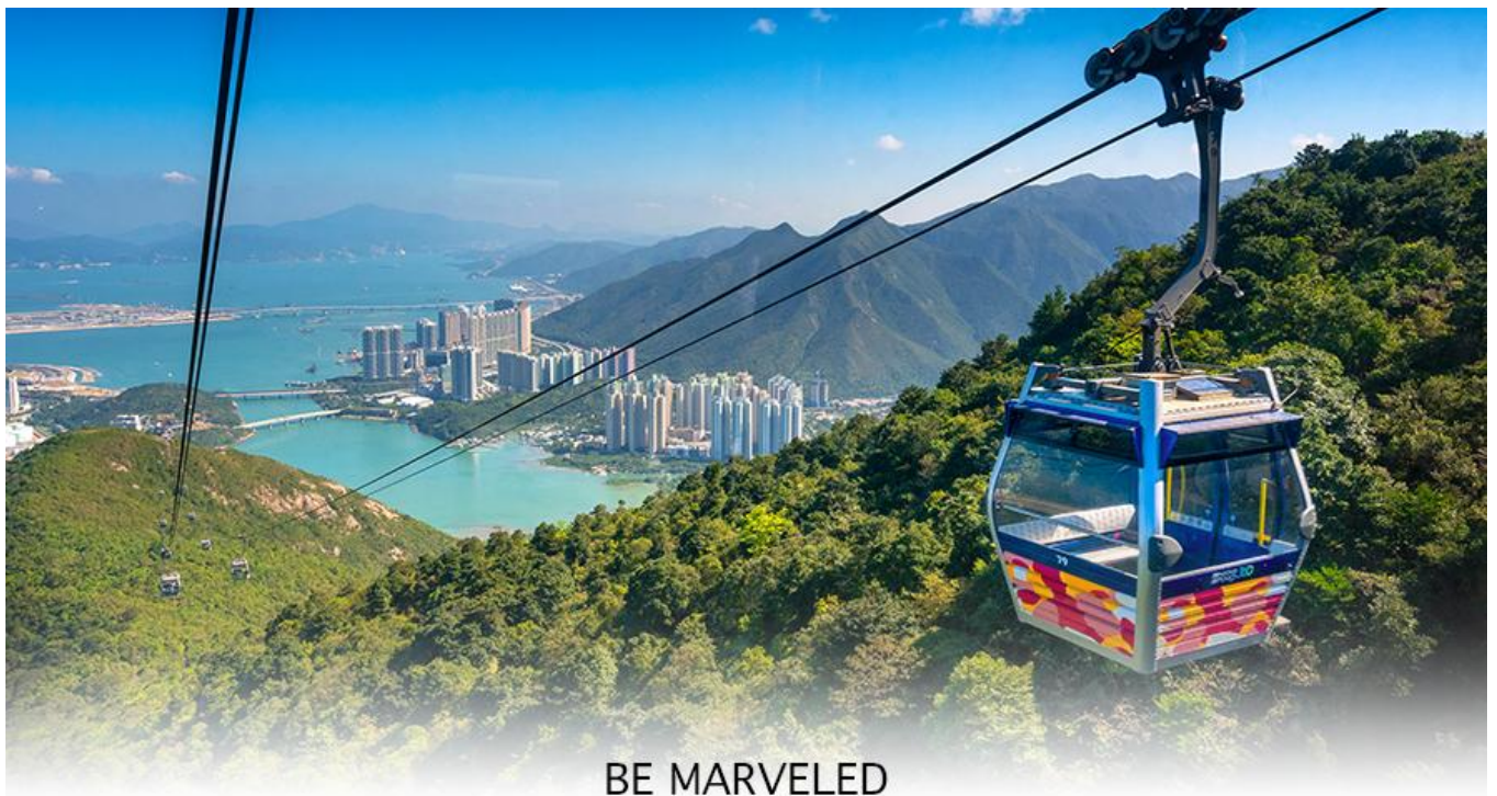
BE MARVELED กระเช้านองปิง

ล่าง ซึ่งการเดินทางขึ้นไปสักการะองค์พระใหญ่อย่างใกล้ชิดนั้น ต้องเดินขึ้นบันได จำนวน 268 ขั้นและได้รับเลือกให้เป็นสิ่งมหัศจรรย์ทางวิศวกรรมขั้นที่ 4 จากทั้งหมด 10 ชั้นของฮ่องกงในปี ค.ศ. 2000 ถือเป็นพระพุทธรูปองค์ใหญ่ที่เป็นสุดยอดของประติมากรรมทางพุทธศาสนาที่มีการผสมผสานระหว่างศิลปะสำริดแบบดั้งเดิมกับเทคโนโลยีสมัยใหม่ ชาวฮ่องกงเชื่อว่า หากใครได้มานมัสการขอพรองค์พระใหญ่แห่งนี้แล้ว ชีวิตก็จะมีแต่ความโชคดี มีความสุขสมหวัง และประสบความสำเร็จในทุกๆ ด้าน หลังจากไหว้พระแล้วท่านสามารถเลือกซื้อของฝาก, ของที่ระลึก จากหมู่บ้านนองปิง อาทิเช่น หยก ไข่มุก หรือเครื่องประดับคริสตัล เพื่อเป็นของที่ระลึก จากนั้นนั่งกระเช้ากลับลงมายังสถานีตุ่งซุง