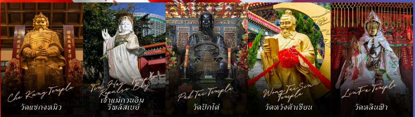
Che Kung Temple วัดแซกงหมิว

รายการทัวร์ข้างต้นอาจมีการปรับเปลี่ยนเพื่อความเหมาะสม