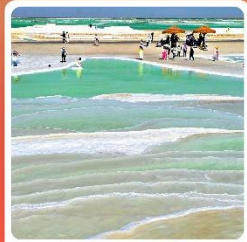
ทะเลสาบเกลือจาเอ้อหนาน

ไฮไลท์! กำมั่วเกาตุ กำพุทศศิลป์โบราณ มรดกโลก UNESCO ภูเขาสายรุ้งจางเย่ ภูเขาหินสีสันแปลกตา หนึ่งในภูมิประเทศที่แปลกที่สุดในโลก