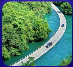
“ ทิวเขาสิงโต ซื่อจื่อกวน ”