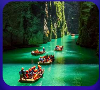
“ ผิงซานแกรนด์แคนยอน ”