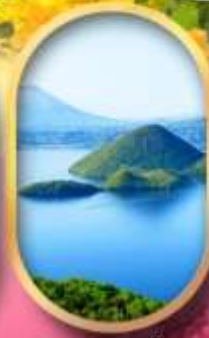
วิวทะเลสาบโทโยะ