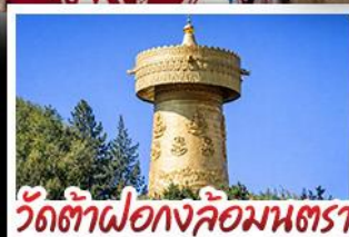
วัดต้าฝอ กงล้อมณฑล