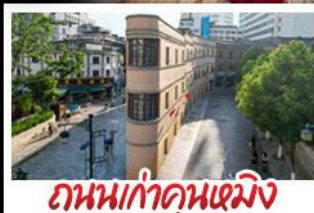
ถนนเก่าคุณหมิง