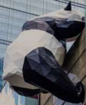
ยานไท่กู่พลี IFS (หมีแพนด้าปีนตึก)

เดินข้ามถนนมาอีกหน่อย ท่านจะได้ซื้อป๊อปปิ้ง ถนนคนเดินชุนซีลู่ (Chunxi Road) เต็มไปด้วยร้านค้าแบรนด์ชั้นนำทั้งในและต่างประเทศ รวมถึงร้านเสื้อผ้าแฟชั่น รองเท้า อุปกรณ์อิเล็กทรอนิกส์ และของฝาก ถนนคนเดินชุนซีลู่เป็นจุดที่มีความคึกคักและเต็มไปด้วยผู้คน โดยเฉพาะในช่วงวันหยุดสุดสัปดาห์และเทศกาลต่างๆ คุณจะได้พบกับการแสดงศิลปะการแสดงดนตรี และกิจกรรมที่น่าสนใจ มีร้านอาหารมากมายที่เสิร์ฟอาหารท้องถิ่นและขนมหวานที่หลากหลาย นักท่องเที่ยวสามารถลิ้มลองเมนูพื้นเมืองที่อร่อย เช่น เสี่ยวหลงเปา (ซาลาเปานึ่ง) หรือขนมโบราณตามรอยซีรีส์จีนอย่าง มาโลโกว ก็มีเช่นกัน