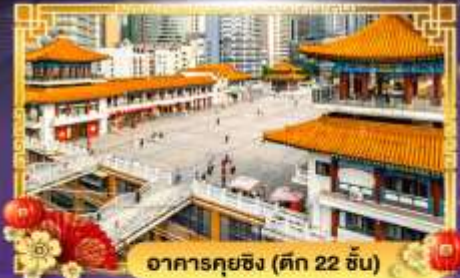
อาคารคุยซิง (ตึก 22 ชั้น)