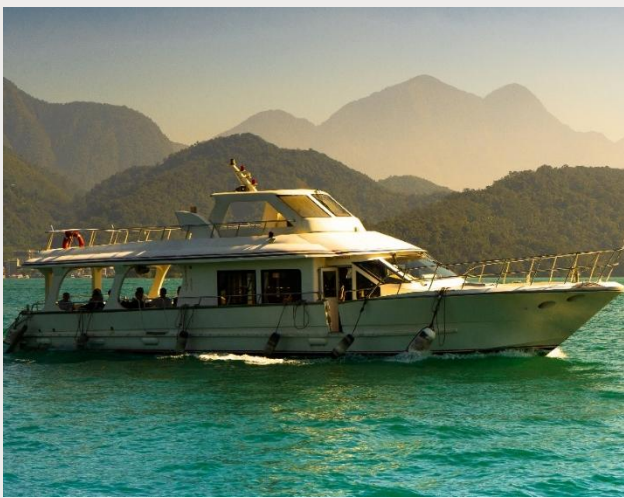
ล่องเรือทะเลสาบสุริยันจันทรา (Sun Moon Lake)

นำท่านเดินทางสู่ วัดพระถังซำจั๋ง (Xuanguang Temple) นมัสการพระอัฐิของพระพุทธเจ้าที่อันเชิญมาจากชมพูทวีป เป็นอีกวัดหนึ่งที่ต้องมาเยือนหากได้มาที่ทะเลสาบสุริยันจันทรา วัดนี้มีรูปปั้นพระถังซำจั๋งให้นมัสการ อีกทั้งมีวิวทะเลสาบที่สวยงาม และพิพิธภัณฑที่จัดแสดงประวัติของพระถังซำจั๋ง ภายในวัดมีบรรยากาศที่สวยงาม เงียบสงบ