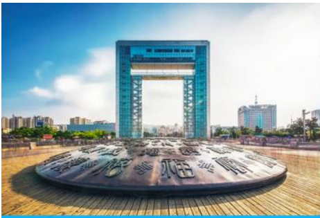
ประตูแห่งโชค