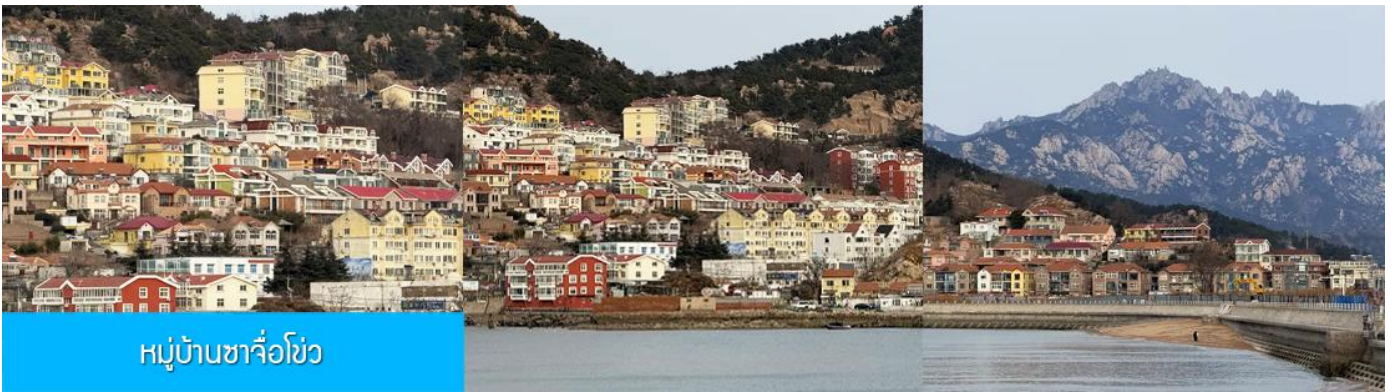
หมู่บ้านซาจื่อโขว่

เที่ยง รับประทานอาหารกลางวัน ณ ภัตตาคาร (มื้อที่ 7)