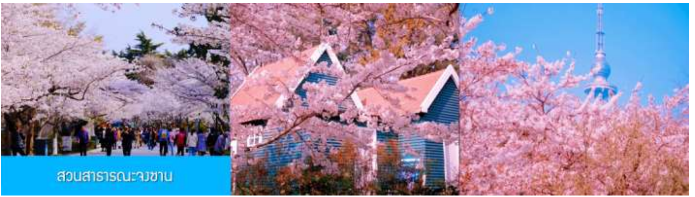
สวนสาธารณะนางซาบ

ถึงชิงเต่า นำท่านชมสวนสาธารณะจงซาน สวนจงซานได้ขึ้นชื่อว่าเป็นสวนที่ชมซากุระสวยที่สุดในเมืองชิงเต่า พอถึงช่วงดอกบาน ต้นซากุระสองข้างทางจะผลิบานพร้อมกัน กลายเป็นอุโมงค์สีชมพูขาว เดินเข้าไปในสวน แล้วบรรยากาศคือหวานละมุน และดูโรแมนติก จะบานช่วงปลายมีนา ถึง ต้นพฤษภาคม