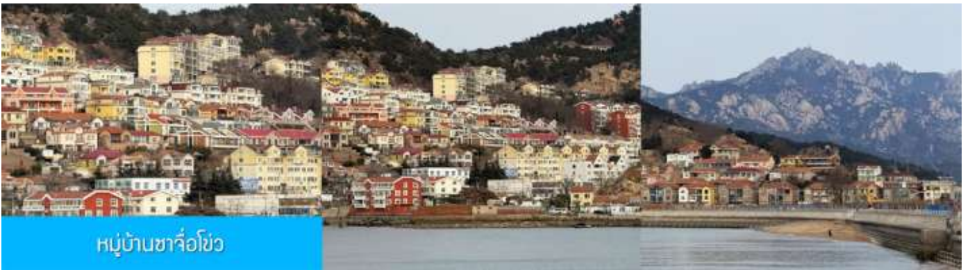
หมู่บ้านซาจื่อโขว่

เที่ยง รับประทานอาหารกลางวัน ณ ภัตตาคาร (มื้อที่ 7)