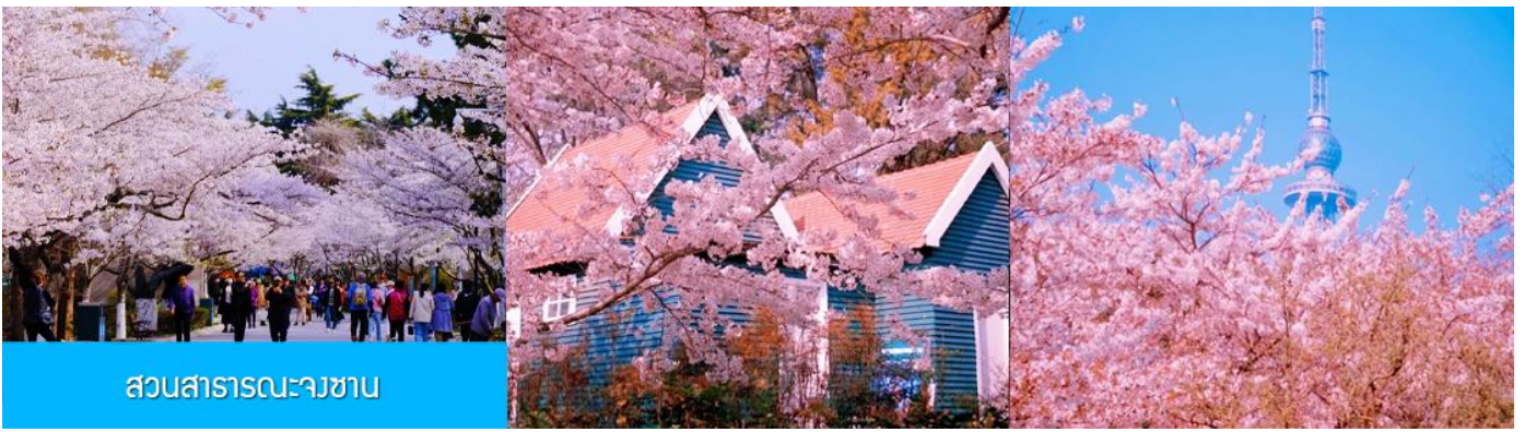
สวนสาธารณะจางซาน

ถึงชิงเต่า นำท่านชมสวนสาธารณะจางซาน สวนจางซานได้ขึ้นชื่อว่าเป็นสวนที่ชมซากุระสวยที่สุดในเมืองชิงเต่า พอถึงช่วงดอกบาน ต้นซากุระสองข้างทางจะผลิบานพร้อมกัน กลายเป็นอุโมงค์สีชมพูขาว เดินเข้าไปในสวน แล้วบรรยากาศคือหวานละมุน และดูโรแมนติก จะบานช่วงปลายมีนา ถึง ต้นพฤษภาคม