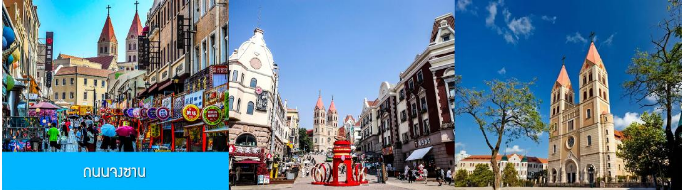
ถนนจงซาน

หลังอาหารนำท่านเดินทางชม สะพานจ้านเจียว เป็นแลนด์มาร์กประวัติศาสตร์คู่เมืองชิงเต่า สร้างเมื่อปี ค.ศ. 1891 มีลักษณะเป็นสะพานหินทอดยาวกว่า 440 เมตรสู่ทะเล ปลายสะพานมีศาลา ทรงแปดเหลี่ยมสีแดงที่โดดเด่น ซึ่งเป็นสัญลักษณ์บนฉลากเบียร์ชิงเต่า ขึ้นชื่อเรื่องวิวสวย รับลมทะเล ให้ท่านเก็บภาพบรรยากาศ จากนั้นนำท่านเดินเที่ยวชม ถนนจงซาน 中山路 ถนนที่เต็มไปด้วยกลิ่นอายยุโรป และถนนสายนี้มีบันทึก เรื่องราวมากกว่าศตวรรษของเมืองชิงเต่าไว้ ที่นี่เป็นศูนย์กลางการค้าแห่งแรกที่เต็มไปด้วยสถาปัตยกรรมสไตล์ ยุโรปเก่าแก่ที่ได้รับอิทธิพลมาจากเยอรมัน ให้ท่านได้เดินเก็บบรรยากาศ และ เก็บภาพกับ โบสถ์เซนต์ไมเคิล (ด้านนอก) โบสถ์แห่งนี้ที่คู่รักนิยมมาถ่ายภาพงานแต่งงานกันมากที่สุดในเมืองชิงเต่า ให้ท่านถ่ายรูปเก็บภาพ จากนั้นเดินทางต่อ สู่ย่าน เมืองเก่าเยอรมัน ตรอกกว้างชิงหลี่ 广兴里 ตรอกชอกชอยที่เรียงรายไปด้วยอาคาร สถาปัตยกรรมแบบ ผสมผสานจีนและอาคารสไตล์ยุโรป