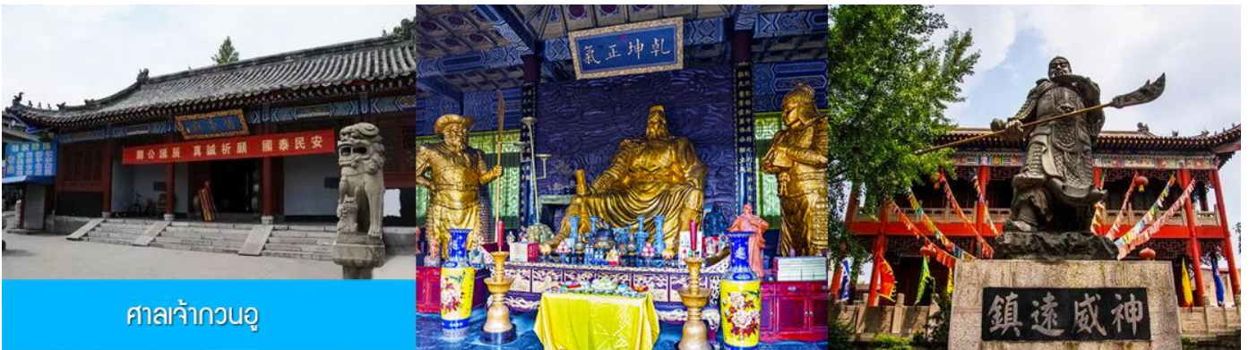
ศาลเจ้ากวนอู