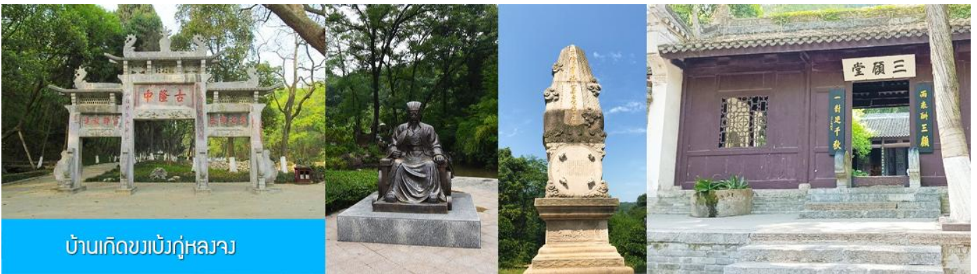
บ้านเกิดขงเบ้งกู่หลงจาง

พักที่ XIANGYANG MEIHAO HOTEL ระดับ 4 ดาวท้องถิ่นหรือเทียบเท่าในเมืองเซียงหยาง