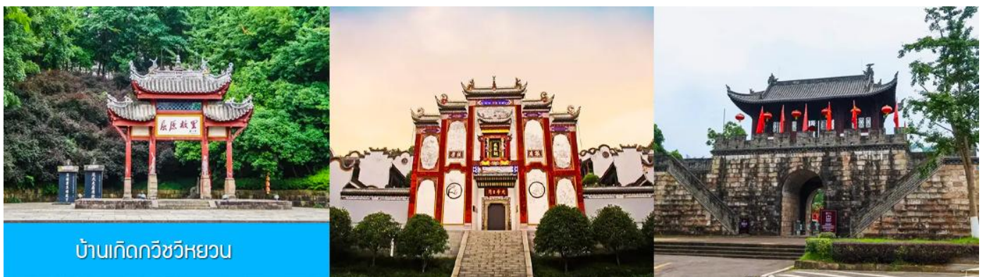
บ้านเกิดกวีซีหยาชวน

พักที่ HONG QIAO HOTEL โรงแรมระดับ 4 ดาวหรือเทียบเท่าในเมืองหยี่ซัง