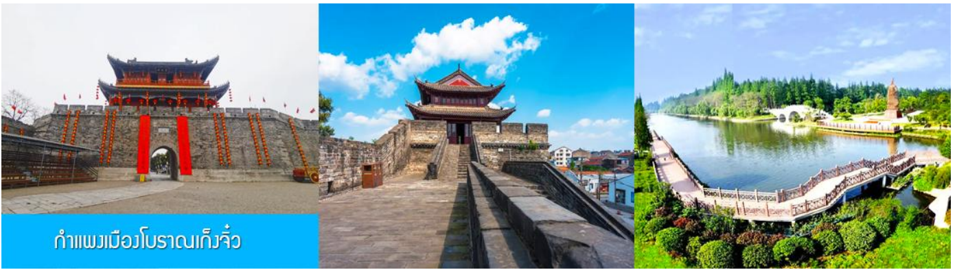
กำแพงเมืองโบราณเกิ่งจิว