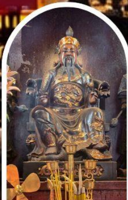
วัดปักไต้ เสริมโชคกลางนำความรุ่งเรืองทุกด้านของชีวิต