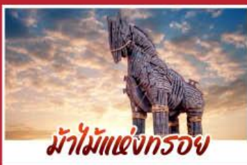
ม้าไม้แห่งกรอย