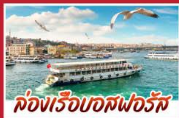
ล่องเรือบอสฟอรัส