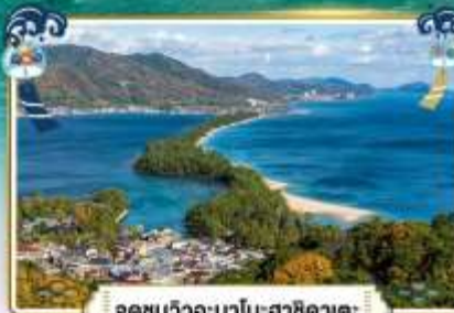
จุดชมวิวอะมาโนฮาชิคาตะ