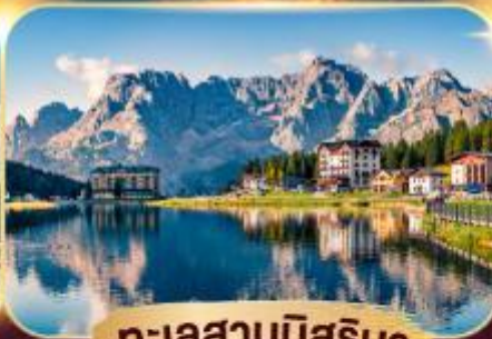
ทะเลสาบมิสุรีนา