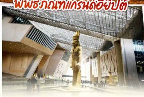
พิพิธภัณฑ์แกรนด์อียิปต์