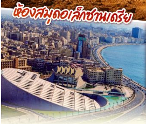
ห้องสมุดอเล็กซานเดรีย