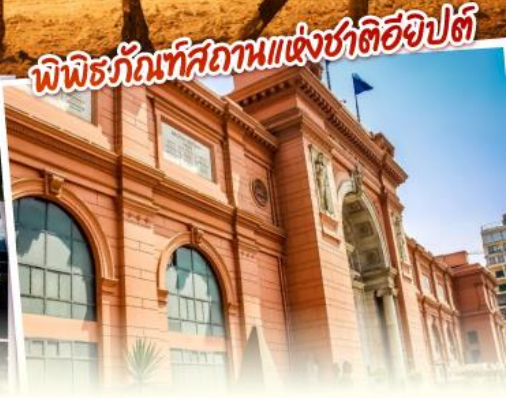
พิพิธภัณฑ์สถานแห่งชาติอียิปต์

ตามรอยอารยธรรมลุ่มแม่น้ำไนล์ ทั้งพีระมิด อเล็กซานเดรีย เมมฟิส ไคโร พิเศษ ทัศนียภาพเมือง พร้อมชมวิวพีระมิดอันยิ่งใหญ่ตระการตา