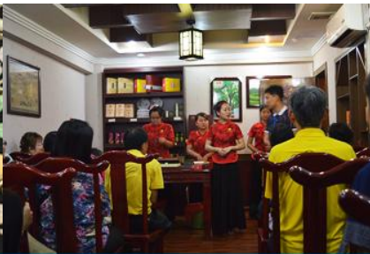
ร้านใบชา