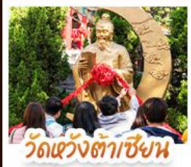
วัดเซ่งต้าเซ็งน