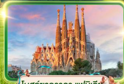
โบสถ์ซากราดา แฟมิลีย