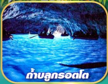
ถ้ำบลูกรอตโต