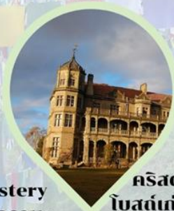
คริสตจักรนีโอโกธิค โบสถ์เก่าแก่ รัฐหิมาจัล