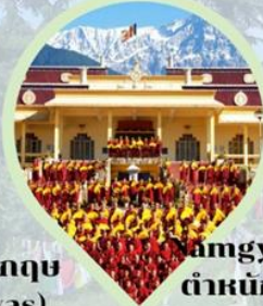
Amgyal Monastery ตำหนักองค์ดาไลลามะ ดาร์มชาล่า