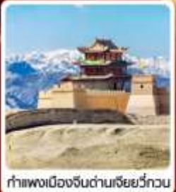
กำแพงเมืองจีนด่านเจี๋ยวิ้วกวน

• ไซโล่...เส้นทางสายไหม ชมสระบัววังพระจันทร์ ทะเลทรายหมีงาช้าง กำแพงเมืองจีนด่านสุดท้าย "เจี๋ยวิ้วกวน" มรดกโลกภูเขาสายรุ้งจางเย่