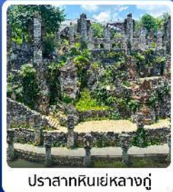
ปราสาทหินเย่หลางกู๋

● ไฮไลท์ น้ำตกหวงกัวซู่ น้ำตกที่ใหญ่ที่สุดของจีน แหล่งท่องเที่ยวระดับ 5A ชมความสวยงาม หมู่บ้านเว่เจียงจ้าย หมู่บ้านจีนโบราณ