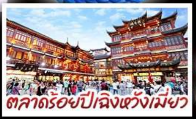
ตลาดร้อยปีฉางหวงเมี่ยว