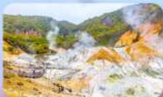
โอบิโรบงส์