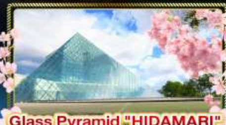
Glass Pyramid "HIDAMARI"