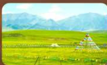
ทุ่งหญ้าออร์คอส