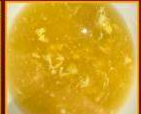
ซุปรข้าวโพด