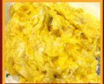
ไข่เจียวทรงเครื่อง