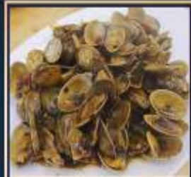
ผัดหอยลาย