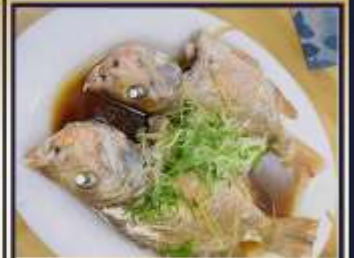
ปลาหนึ่งซีอิ๊ว