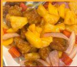
กระดุกหมูผัดเปรี้ยวหวาน