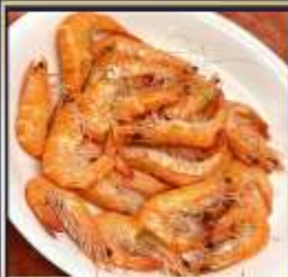
กุ้งหวานลวก