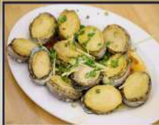
เป๋าฮื้อสดนึ่ง