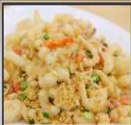
หมึกทอดกระเทียม