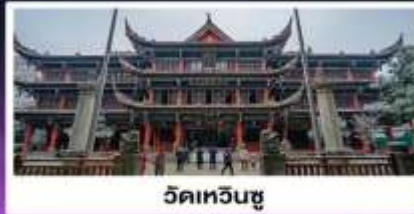
วัดเหวินซู