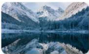
ปี้ฝิงโกว