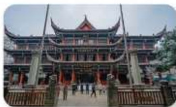
วัดเหวินซู