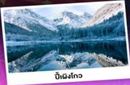
บี้ฝิงโกว