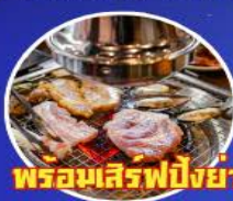
พร้อมเสิร์ฟปิ้งย่างเกาหลี