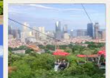
กระเช้าชมเมือง