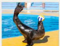
POLAR OCEAN PARK