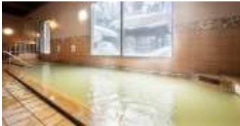
หลังอาหารค่ำ ให้ทุกท่านผ่อนคลายกับการแช่น้ำแร่ธรรมชาติสไตส์ญี่ปุ่น