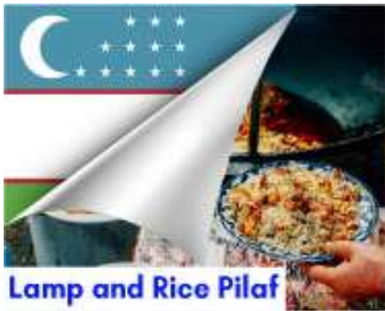
Lamp and Rice Pilaf